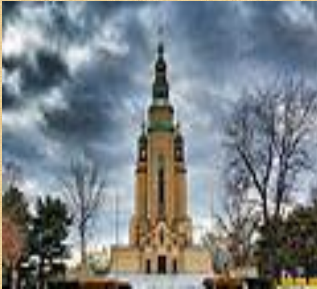
Церква святого Андрія у Саут-Баунд-Брук. Збудована 1965 року в пам'ять Голодомору в Україні.