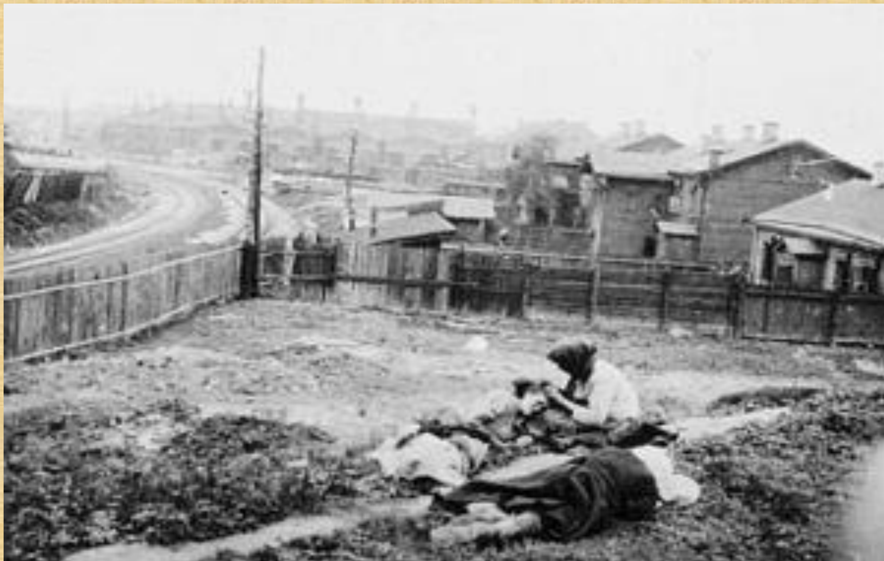
Жертви голоду. Харківщина, 1933 рік