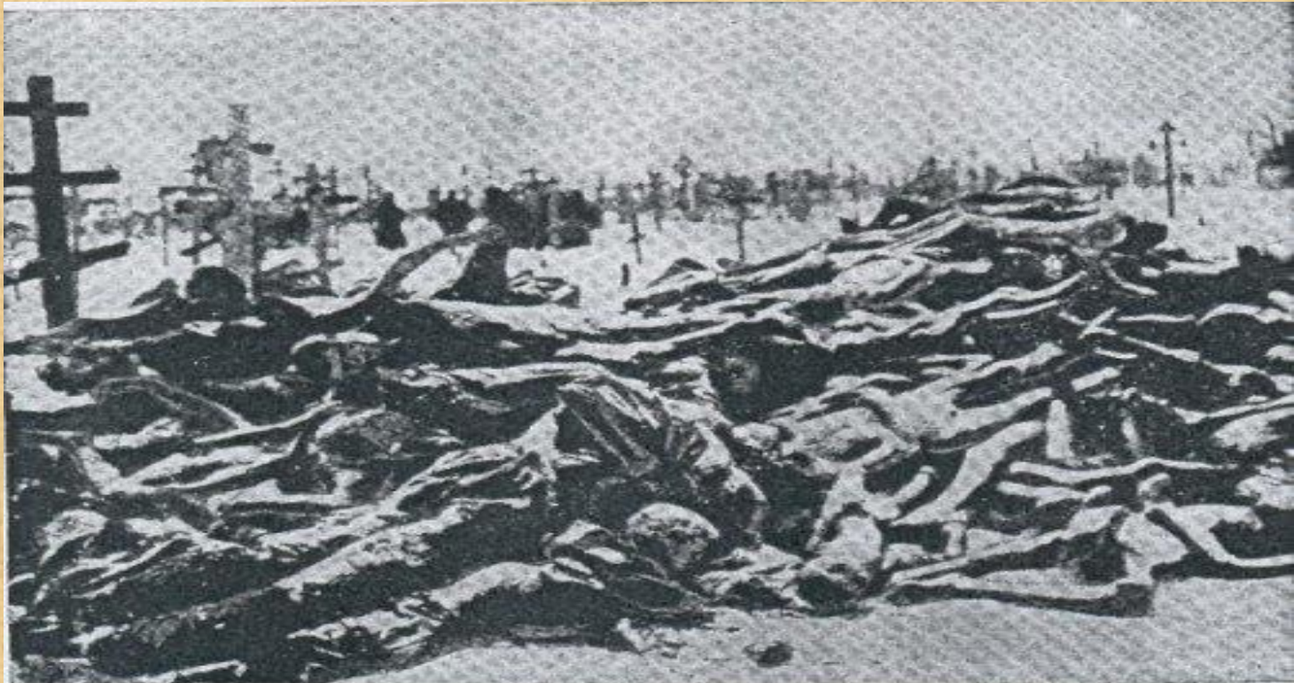
Кладовище в Харкові. Замерзлі трупи українських селян померлих з голоду. 1933 р.

За підсумками судової справи за фактом Голодомору було встановлено, що кількість людських втрат від Голодомору 1932-1933 років складає 3 мільйони 941 тисяча осіб. Втрати українців в частині ненароджених, що за даними слідства СБУ становлять 6 мільйонів 122 тисячі осіб судом не встановлювалися.